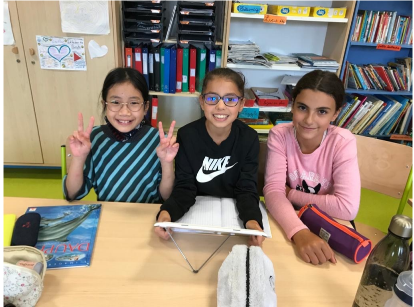
Des élèves de Mm. Dowdall concentrés sur la rédaction de leur article.