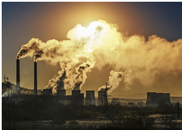
Image des gaz rejetés par une usine.